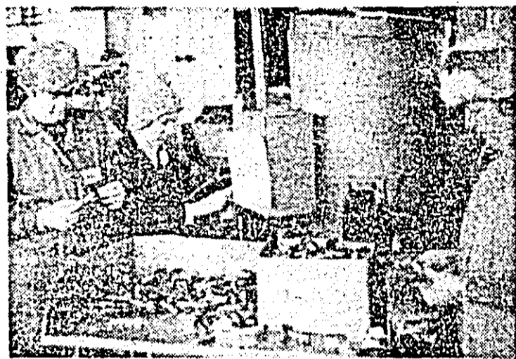
Aspect de muncă în secția a III-a de la I.A.M.M.B.A.