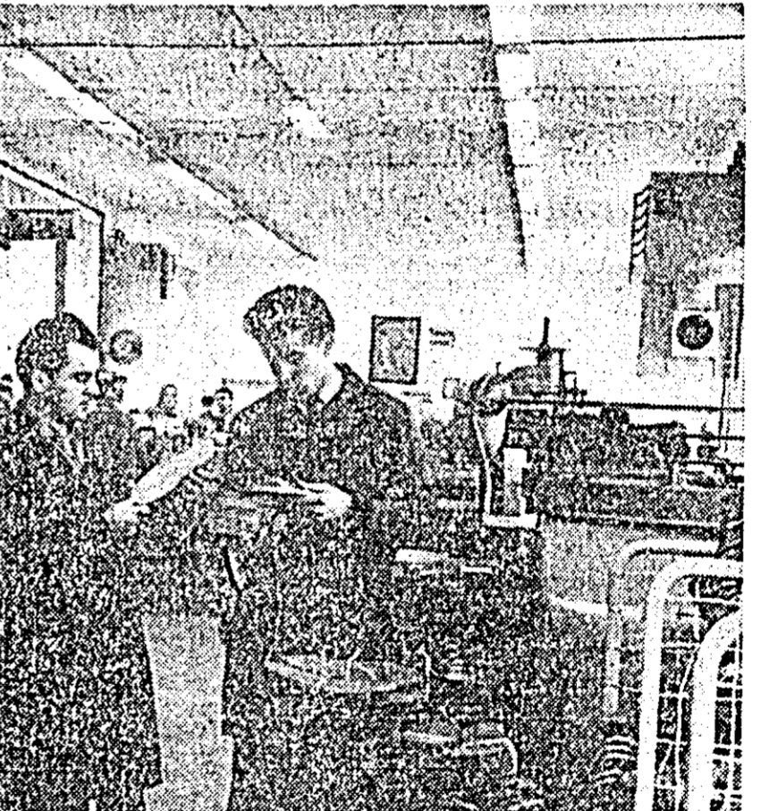
Fabrica de încălțăminte „Libertatea”. Vedere din hala de ștanțe.

În vederea recrutării, pregătirii, repartizării și promovării cadrelor medii și auxiliare sanitare, Ministerul Sănătății și Prevederilor Sociale va organiza în acest an două sesiuni de concurs pentru admiterea în școlile profesionale (1—12 iulie și respectiv 1—10 septembrie); două sesiuni pentru admiterea în școlile tehnice (26—30 septembrie și respectiv 1—10 octombrie) și o sesiune de admitere pentru liceele de specialitate de tehnică dentară, care va avea loc în luna iulie. Elevilor le vor fi puse la dispoziție localuri corespunzătoare — săli de clasă, internate și cantine — în special în orașele centrale regionale ca: Baia Mare, Suceava, Cluj, Constanța, Bacău, Iași și Timișoara, precum și în localitățile Rădăuți, Dobrohol, Bîrlad, Turmă Măgurele, Slobozia și Cîmpulung-Muscel, unde există un număr mai scăzut de asemenea cadre. În urma absolvirii școlilor profesionale și tehnice sanitare, în acest an: la 1 septembrie, vor fi încadrați în unitățile sanitare 7.400 absolvenți care se vor alătura celor peste 80.000 de cadre medii și auxiliare sanitare. (Agerpres)