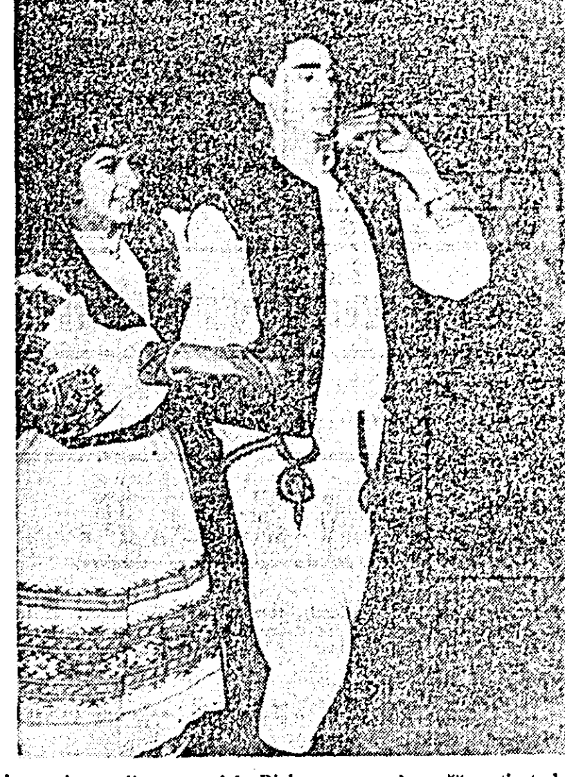
Aspect din spectacolul „Dialog pe aceeași scenă” susținut de formațiile artistice ale Uzinelor „30 Decembrie” și fabricii „Te-ba”. În imagine echipa de dansuri a uzinelor „30 Decembrie”.