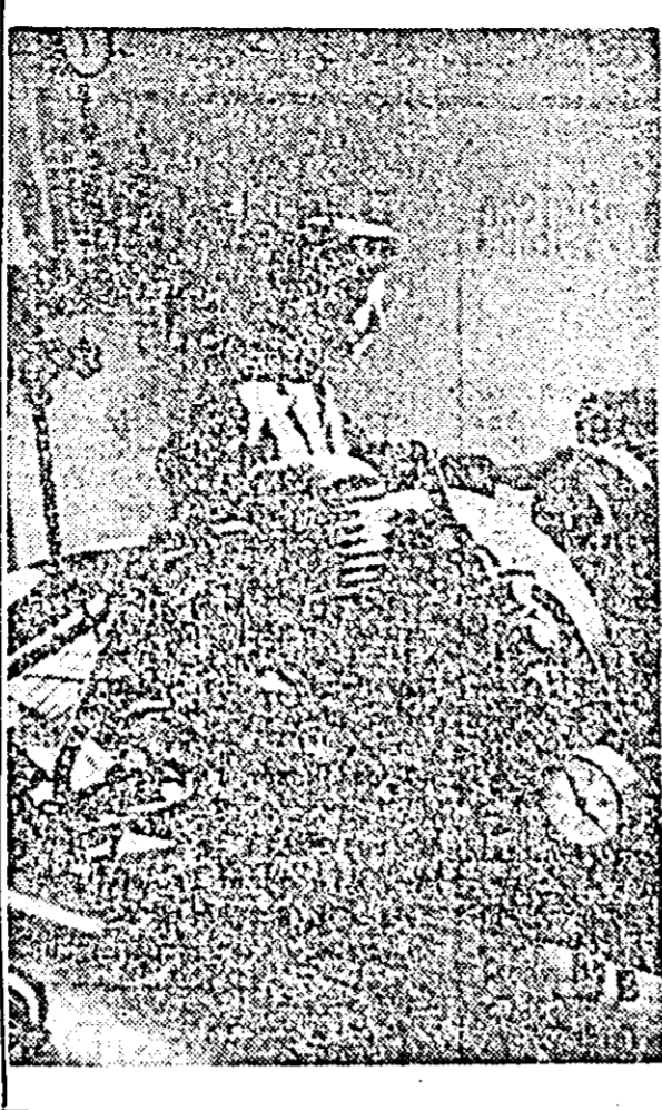
De curînd a fost dată în funcțiune stația de transformare de 110 KV...