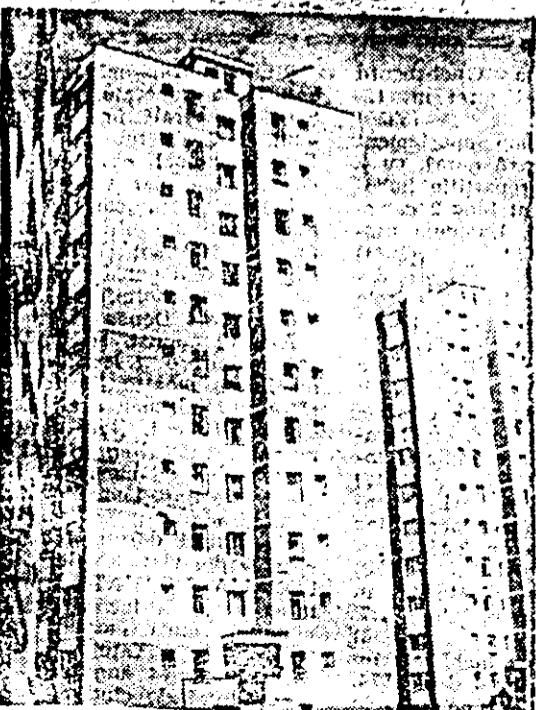
Zona Aurel Vlaicu se îmbogățește merelu cu noi blocuri moderne, care oferă unui număr tot mai mare de oameni ai muncii să locuiască în condiții dintre cele mai bune.