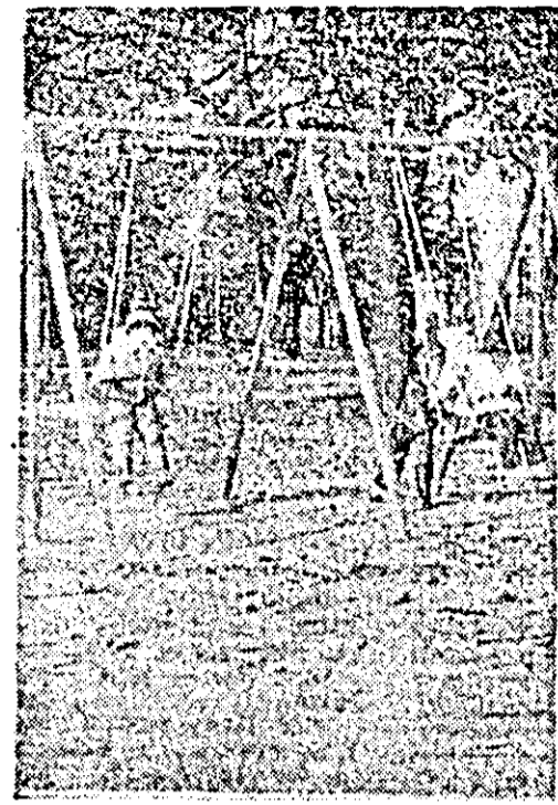
Toamnă...