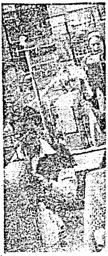
Secvență de muncă de la întreprinderea „Ardeanca”.