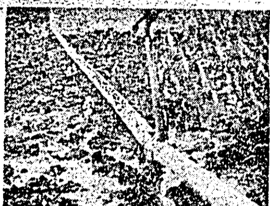
La I.A.S. Fintinele, instalațiile pentru ploaia artificială funcționează fără întrerupere.