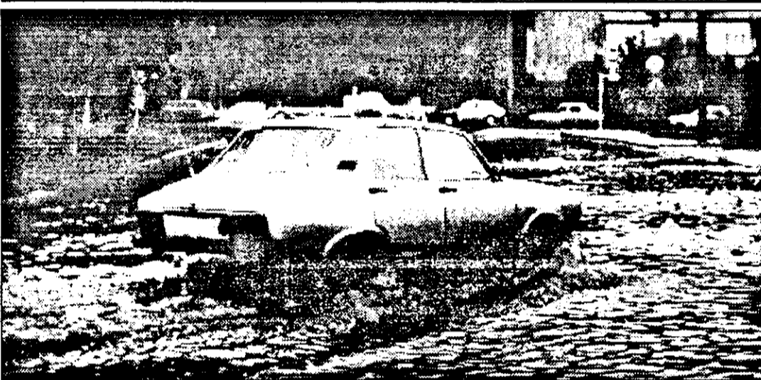
Datorită averselor de ploaie căzute în ultima vreme, însemnate cantitativ, zona Podgoria a devenit un adevărat lac, chiar lângă lacul de la Pădurice.