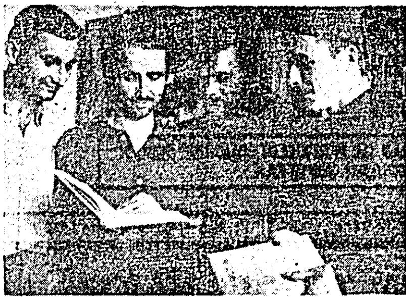
Un grup de uteciști de la Atelierul CT 5 CFR în biblioteca tehnică.