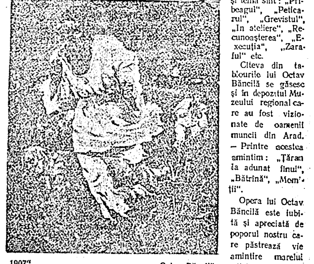
„1907” Octav Băncilă artist.