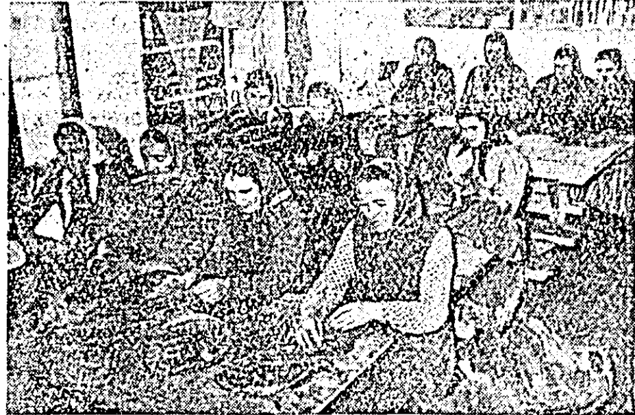
În clișeu: colectiviste de la gospodăria agricolă colectivă „Proletarul” din Șofronea alegînd și legînd tutunul.

acum. Colectiviste mai ales, și-au găsit ocupație în zilele acestea alegînd și legînd foile de tutun pentru a fi trimise la fabrică.