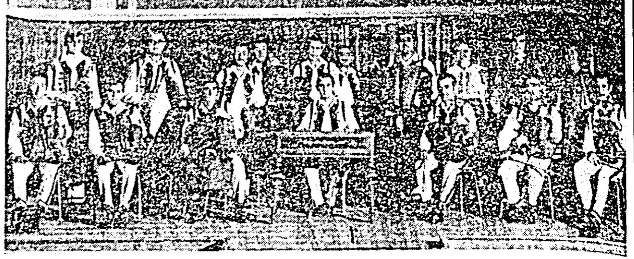
Programul „Zilelor muzicale arădene” cuprinde azi un concert de muzică populară, în CLISEU: orchestra populară a Filarmonicii.

— Vă mulțumim. Discuție consemnată de STELA GABOR