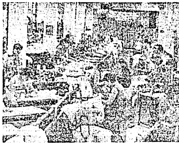
Aspect de muncă la întreprinderea de confecții Arad.