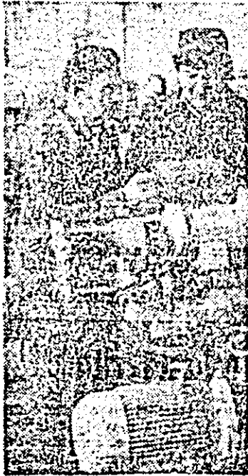
Aspect de muncă în secția montaj a I.M.U.A.

● La Strasbourg au început lucrările primel sesiuni din acest an a Adunării Consiliului European occidentale. Participă delegații din cele 21 de țări membre.