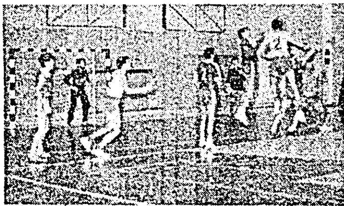
Fază din meciul Constructorul Arad — Proleter Zrenjanin.