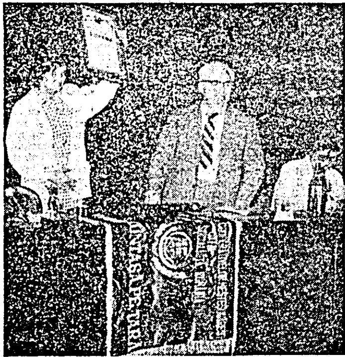
Moment emoționant: se înmînează înaltele distincții cooperativei arădene.

Actionînd pentru transpunerea în viață a programelor privitoare la dezvoltarea industriei mici și a prestațiilor de servicii, elaborate pe baza indicațiilor tovarășului Nicolae Ceaușescu — s-a arătat în informarea prezentată cu acest prilej — oamenii muncii din unitățile cooperativei meșteșugărești a județului Arad, sub conducerea Comitetului Județean de partid cît și a forului tutelar UCECOM au obținut în anul cincinalului precedent, dar mai ales în anul 1985, rezultate bune în îndeplinirea și depășirea indicatorilor de plan. Prin utilizarea superioară a capacităților de producție și a forței de muncă, prin ridicarea productivității muncii și folosirea mai bună a timpului de lucru, indicatorul general al activității cooperativei — valoarea producției marfă industriale și a prestațiilor neindustriale, a fost realizat în proporție de 107,2 la sută, reprezentînd o producție peste plan în valoare de 95,3 milioane lei. În mod similar a fost depășit și indicatorul producției marfă industriale — 107,4 la sută. Preocupăți de dezvoltarea și diversificarea prestațiilor de servicii, de apropierea lor de domiciliul clienților, cooperativele meșteșugărești arădene