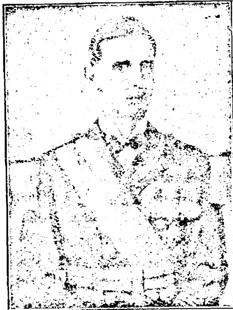
A. S. R. principele Nicolae.

A. S. R. prințul Nicolae a fost îndelung ovaționat de întreaga asistență.