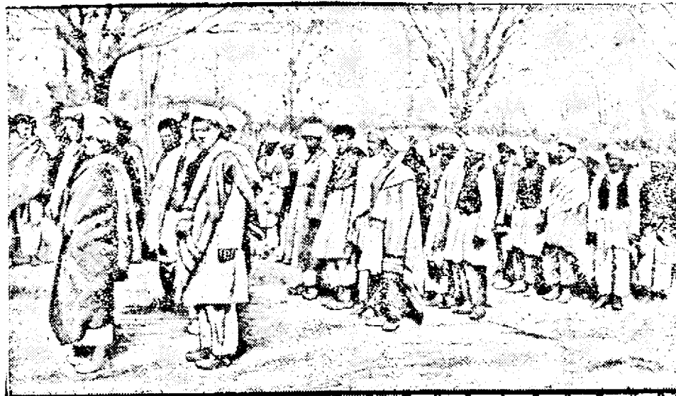
Cliseul nostru arată marșul unui imens grup de recruți de-ai lui Habib-Ullah pe străzile capitalei Afganistanului.

Fratele regelui Afganistanului, Habib Ullah are să-și mulțumească victoria recruților săi, pe cari i-a putut câștiga de partea sa în Kabul. El devenit odată stăpânul situației în Afganistan, a ordonat dizolvarea tuturor legațiilor afganistane din străinătate, rămase credincioase lui Aman-Ullah. Legațiile din Franța, Italia și Rusia vor fi complect supimate, iar dânsul va lua iarăși titlul de emir. În armată nu va mai păstra decât instructori francezi și englezi.