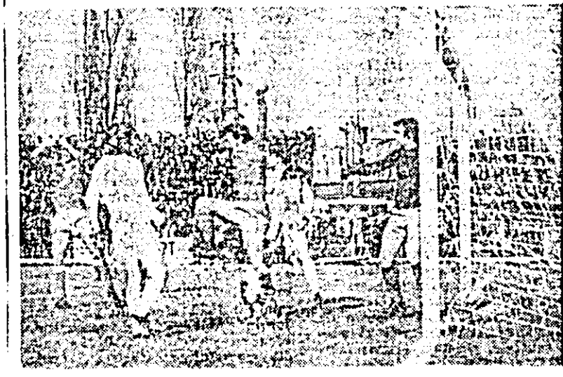
Bucurio, entuziasm: s-a marcat primul gol în meciul U.T.A.—Corvinul.

„Flacăra roșie”: I. Leac — 3 puncte; II. Cura — 2 puncte; III. Ducadam — 1 punct. Clasamentul: I. Kukla — 31 puncte; 2. Damido — 30 puncte; 3. Leac — 24 puncte; 4—5 Schepp și Cura, câte 20 puncte; 6. Broșovschi — 19 puncte; 7. Gașpar — 15 puncte; 8. Jivan — 12 puncte; 9. Gurgiu și Ducadam, câte 5 puncte; 10. Vaczi — 2 puncte; 11. Gal — 1 punct.