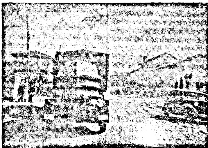
O companie de pionieri germani, echipată cu tot utilajul, în marș prin Bulgaria