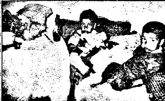
Închiși în casă, frații Răzăilă își așteaptă părinții. Zilnic, timp de ore întregi...

singură cameră, situată într-un capăt al Șiculei! Acestei femei nu i-a spus nimeni vreodată o vorbă bună. Și poate de aceea, cu timpul, s-a sălbăticit. Oamenii spun că nu este normală. Cum să creadă altfel,