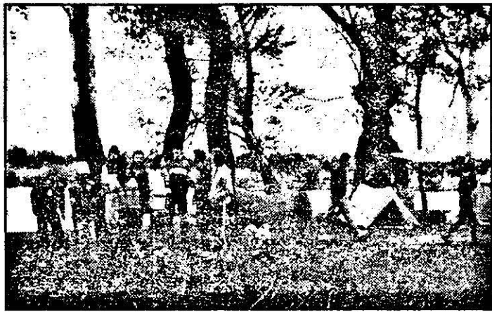
„Noaptea tremurăm de frig în corturi. Ziua facem plajă-n blugi”.

vărul. Oricum, avem pe insulă 380 de cabane și vreo 500 de locuri. Avem planuri mari - vrem să construim o asociație a locatarilor, să facem aici un dispensar, o centrală telefonică - lucruri de care avem absolută nevoie. Doar tinerii salvează situația - atâția n-am văzut