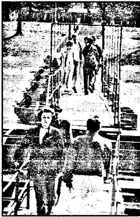
De acum, toate drumurile duc la ... strand!

Bazinele strandului sunt goale. Pe timp favorabil se pot umple cu apă într-o noapte. Dușurile sunt în stare de funcționare. Din păcate, sursa de apă ter-