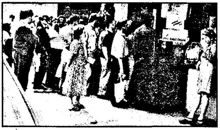
Aglomerație mare la sediul FPP 1 Banat Crișana în ultima zi de subscriere.