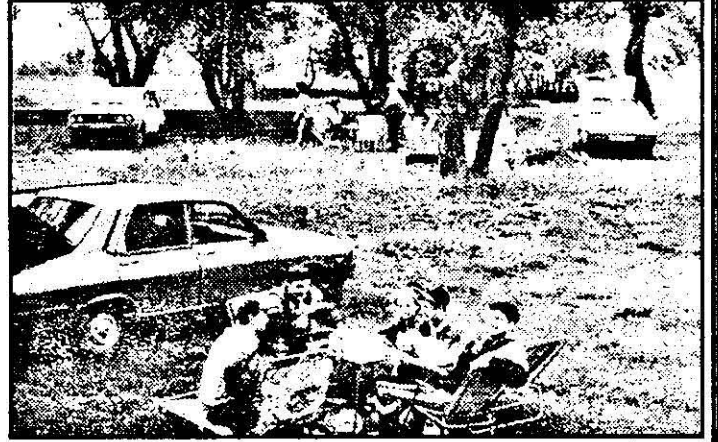
Tinerii știu cum să-și petreacă ziua de 1 Mai. În pădurea Vladimirescu se sărbătorește din plin.

s-au scaldat în speranța că soarele își va pune amprenta pe pielea albă după o iarnă atât de lungă. Întrebați cum se distrează, tinerii ne spuneau că: „ne simțim foarte bine. Cu numai 50.000 lei am reușit să ne petrecem o zi de neuitat”. Și nu ne îndoiim de acest lucru, mai ales că n-au lipsit nici tiganii care, încăleccând pe cai, au făcut câteva tururi de forță în zonă. Dacă toți își pregăteau focul pentru grătare cu lemne din pădure, românii au preferat o metodă mai simplă: cauciucul.