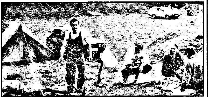
Mirosul de grătare îți aducea aminte de anii trecuți, când la fiecare colț de stradă erau tarabe cu bere și miștii. Ieri, doar cei care și-au preparat singuri grătarele le-au putut consuma.

La cabana de la Ghioroc nimeni nu cuteza să-și instaleze corturile. Aici zona e închisă deoarece se lucrează la micul „Las Vegas”. Deschiderea sezonului estival i-a prins pe cei