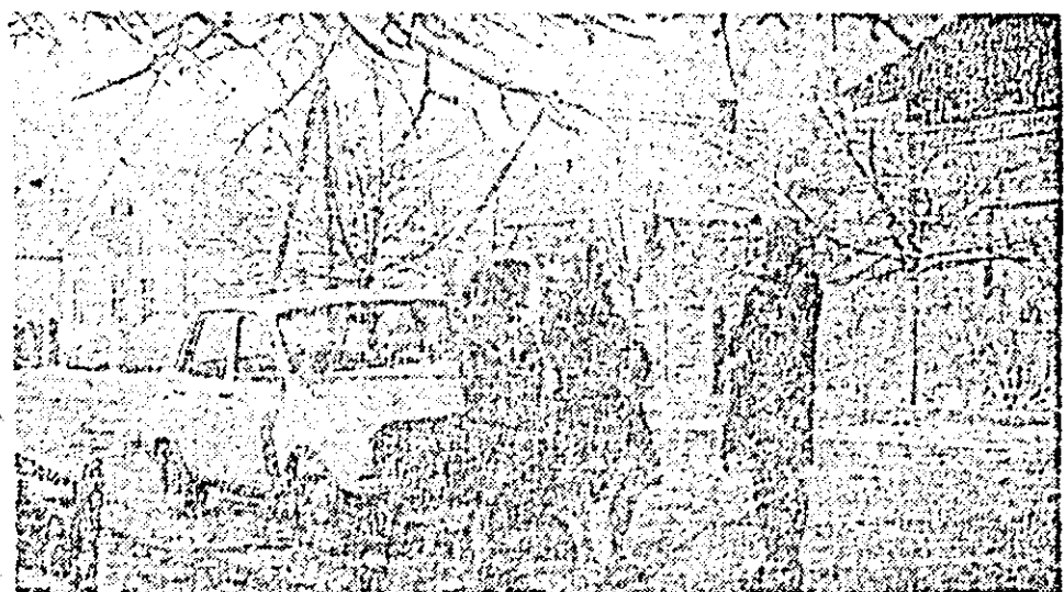
Strada — oglindă a înnoirii satului.

Într-o comandă de Zăbrani unde, îndată după Plenara C.C. al P.C.R. din 3-5 martie 1970, s-a înființat, una dintre primele cooperative agricole de producție din țară — istoria ultimelor trei decenii s-a îmbogățit cu lile demne de hărnicia oamenilor de pe aceste meleaguri, români și germani, uniți prin aceleași idealuri.