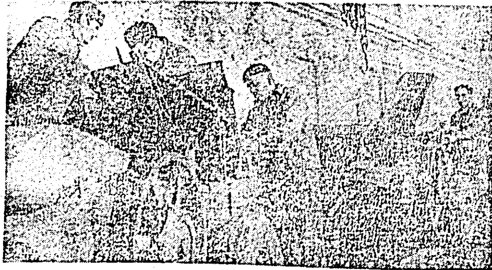
Utilajele agricole se repară într-un centru modern.