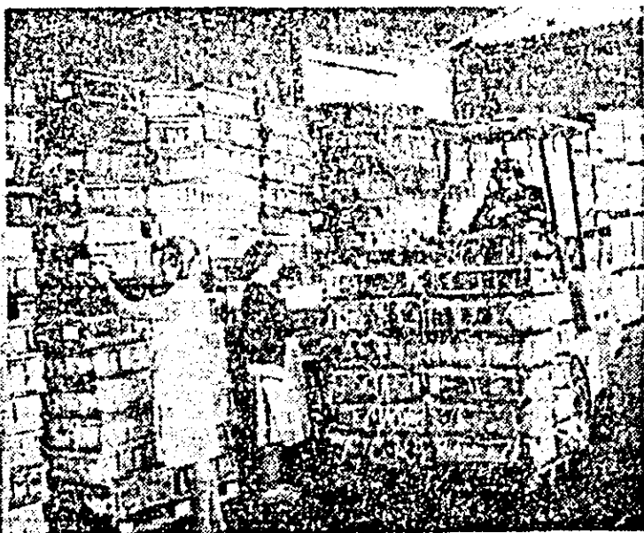
Aspect din depozitul produse finite al secției de industrializare a C.L.F. Chișineu Criș.

Trageroa din 6 august. I. 41 1 42 19 26 15 II. 22 6 3 12 23 17