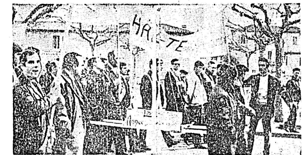
În întreaga Franță au avut loc o serie de mari greve și demonstrații muncitorești în sprijinul unor revendicări economice și împotriva închiderii unor mari întreprinderi. În fotografie: Aspect de la marșul de protest al muncitorilor de la șantierul din La-Seyne, amenințați de somaj în urma proiectului de închidere al șantierelor.