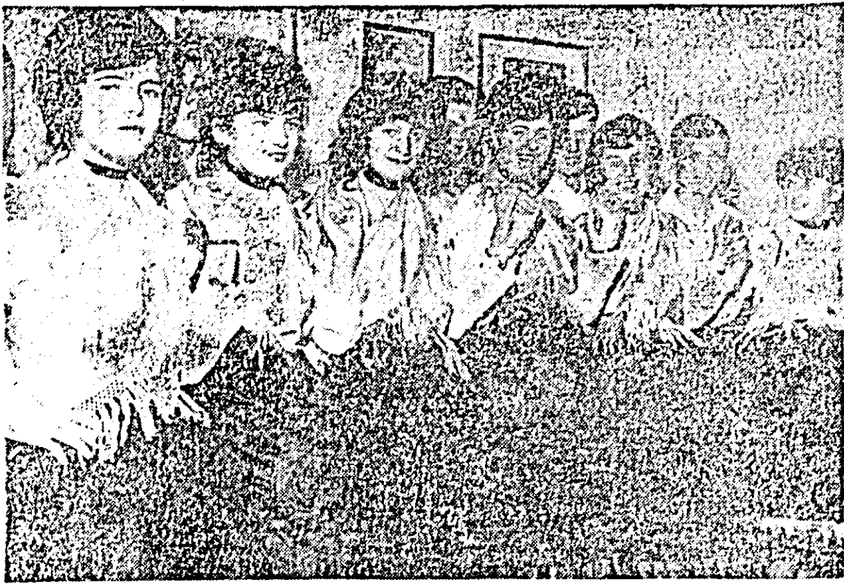
Echipele de dansuri populare germane din comuna Vladimirescu se bucură de o frumoasă apreciere din partea spectatorilor.

Organizat din inițiativa Comitetului rațional pentru cultură și artă, întrecerile dintre formațiile de amatori ale comunelor Pecica și Nădlac, sub formă de dialog (inspirat după binecunoscuta și apreciată acțiune a televiziunii române), a creat posibilitatea afirmării multor talente din popor și, în același timp, a constituit un mijloc eficient de cunoaștere reciprocă a activității culturale a acestor comune. Locul în care a avut loc duminică în sala cîminului cultural din Pecica s-a bucurat de un deosebit succes. Peste 600 de spectatori pecteani și nădlăcani, care au umplut sala pînă la refuz, au venit să vadă această frumoasă întrecere și totodată să-și susțină reprezentanții. Bogatul și variatul program prezentat de ambele comune constituie, fără îndoială rezultatul unei serioase munci culturale. El a cîștigat un plus de culoare prin prezentarea unor numere ale naționalităților conlocuitoare, maghiari, respectiv slovaci.