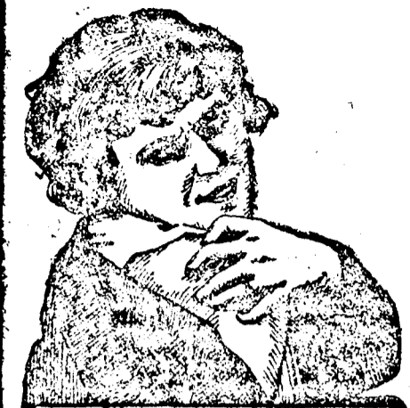
Az igazító és pennibilis hímlők azonnal eltűnnek, ha a CADU-RENŐCSÖT használja

A szociáldemokrata Helmer tartományi tanácsos azt kiáltotta a keresztény szociálisták felé, hogy a tözsdén játszottak el a népek a pénzt. Reither tartományi kormányzóhelyettes válaszolt erre és a választ a legdurvább vitatkozás követte. Az ellenfelek ököllel rohantak egymásnak és a súlyosabb tetőfességet csak nagy nehezen