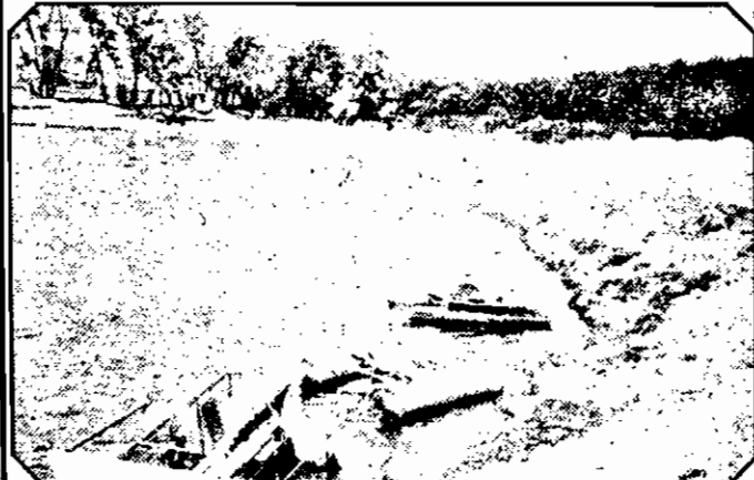
Asta a mai rămas din mult solicitate hidro-ciclete. O parte din ele zac pe fundul lacului. Și ultimele trei, probabil, dacă nu vor fi urgent reparate, vor părăsi lumina zilei scufundându-se în adâncul întunecat al lacului. Proasta organizare își spune din nou cuvântul...

buie să conduci cu foarte multă dibăcie. Grăpile din asfalt pot oricând să-ți aducă surprize deloc plăcute. Primăria o fi uitat de acest drum, la fel ca și de celelalte din municipiu. Și uite așa, cam