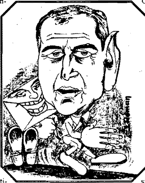
VALER SUIIAN către GHEORGHE FUNAR: - Ghiță, iar vrei să ne bagi în rahat!