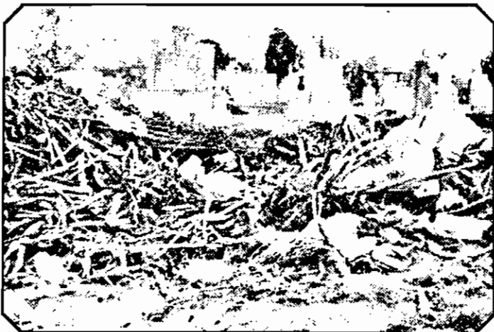
Prin indiferența aleșilor locali și a administrației cimitirului din Gai, mizeriile din rampa de gunoi a municipiului invadează mormintele!

înșă în tot cartierul nu funcționează nici o alimentară! Nici măcar un punct de distribuție a pâinii sau a laptelui... Oameni bătrâni, pensionari, sunt nevoiți să facă pentru o pâine 9 kilometri întregi. Pe jos,