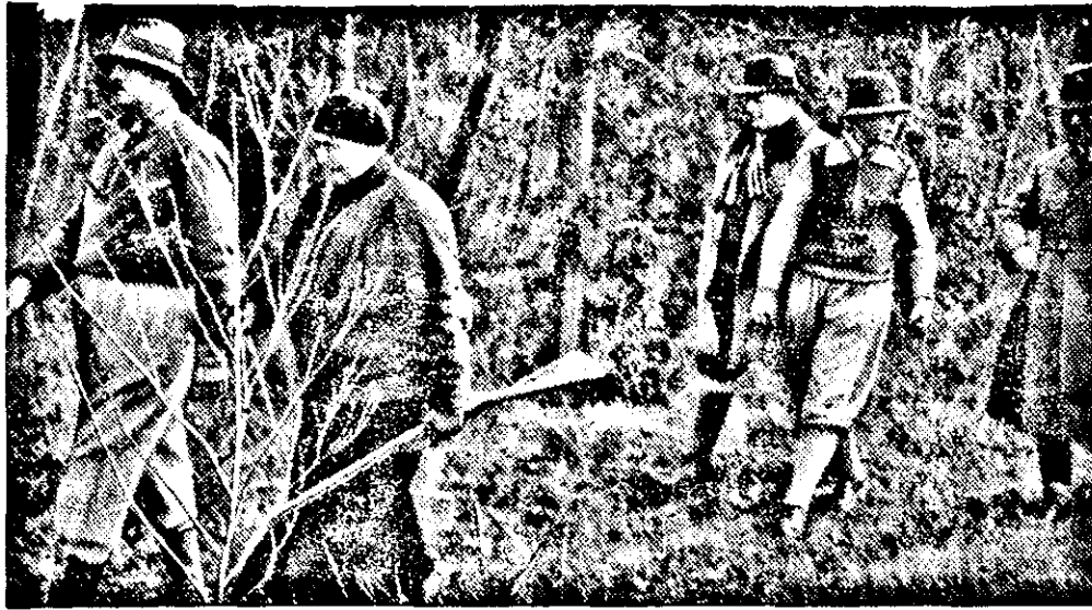
Zu Ehren der Königinwitwe Maria von Jugoslawien, der Schwester des Königs Karl, wurde nächst der Hauptstadt eine Jagd veranstaltet. Auf unserem Bild ist die Königinwitwe, König Karl und der Thronfolger Michael zu sehen, wie sie sich zur Jagd begeben.