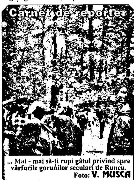
... Mai - mai să-ți rupi gâtul privind spre vărfurile gorunilor seculari de Runcu.

puternic al terburilor, al minții, frăguțelor și murelor crescând în roua ce nu se zvânțase pe de-a-ntregul nici la orele amiezii și-n mirosul florilor și al putregaiului natural de fag și gorun. Dar, departe de noi ideea