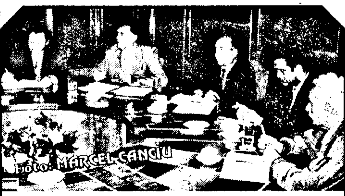
Masă rotundă organizată de ziarul „Adevărul”