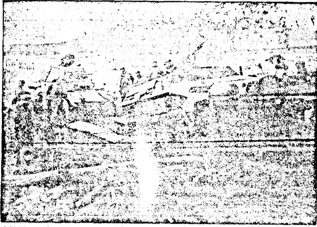
Tancuri germane de front de Răsărit

disperate ale Rusiei: întrucât producția industriei americane nu poate să facă față nevoilor Marelui Britanii și pregătirea militară a Statelor Unite.