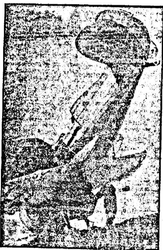
Sfârșitul unui avion Rata

tru o culpa de fals în acte publice și pentru indemn la fals. Astăzi vor veni spre confirmare aceste mandate de arestare în fața Tribunalului timișorean.