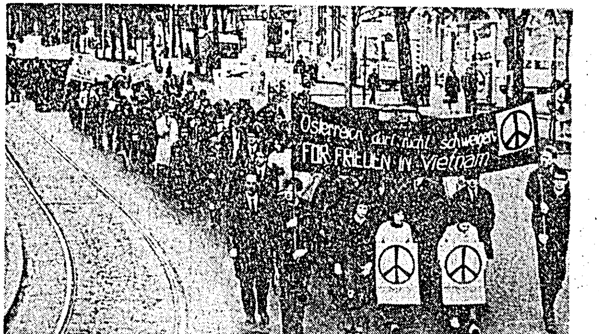
AUSTRIA. — Aspect din timpul „marșului de primăvară”, care a avut loc la Viena și în cursul căruia mai multe mii de cetățeni au cerut încetarea războiului dus de SUA, în Vietnam.