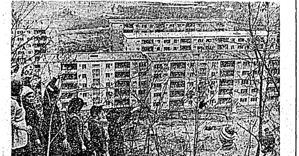
Priveliștii noi în orașul Orșova.