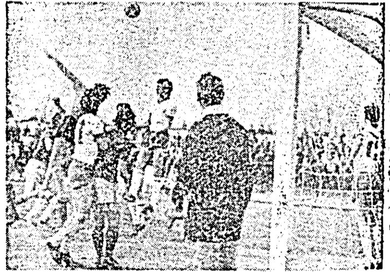
Dueluri repetate, crîncene, la poarta „înfrățirii”, așa cum putem vedea unul în clișeu alăturat. Totuși, Gloria a pierdut.