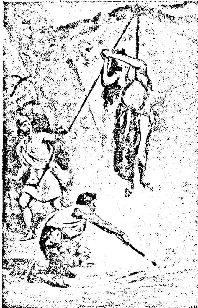
● mamă creștină în flăcările focului

mani, erau scoși din cadrele armatei și oricine își arăta vreo râvnă pentru Creștinism era pur și simplu omorât. Cruzimile în urma deciziilor lui Dioclețian, au fost de nedescris. Toate casele de rugăciune creștine au fost dărâmate și șterse de pe suprafața pământului. Toate bibliile găsite și confiscate, au fost arse. Toți creștinii au fost dați afară din slujbele statului. Timp de opt ani, focul, sabia, crucea, rugul, fiarele sălbatice, și oamenii sălbăticiți și-au continuat lucrul de nimicire al Creștinismului. Martirii lui Isus erau junghiați toată