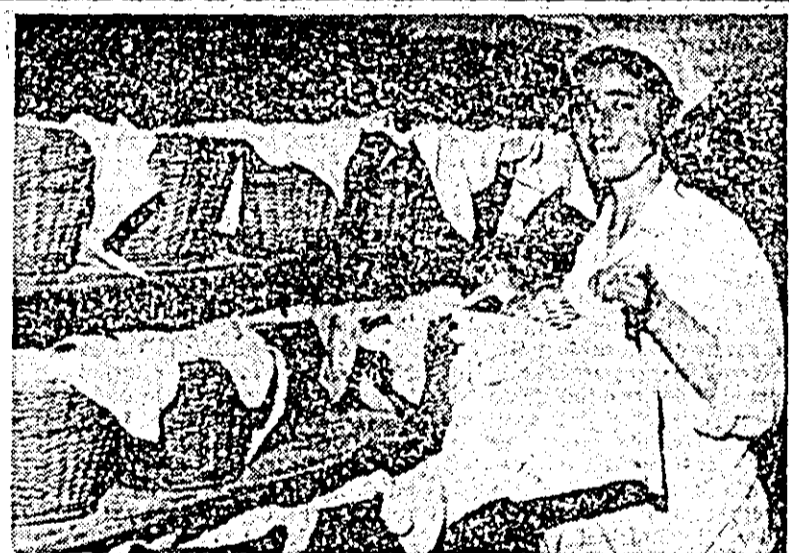
Instanțianu dintr-o secție a fabricii de morărit și panificație: plina cea rumenă și gustoasă face, deocamdată, un ultim popas aici, la dospit.

Circumscripția financiară a municipiului Arad face cunoscut celor care realizează venituri din închirieri sau subînchirieri că sînt obligați să le declare în termen de 5 zile. Nedeclararea lor atrage sancțiuni contravenționale între 400—1 000 lei.