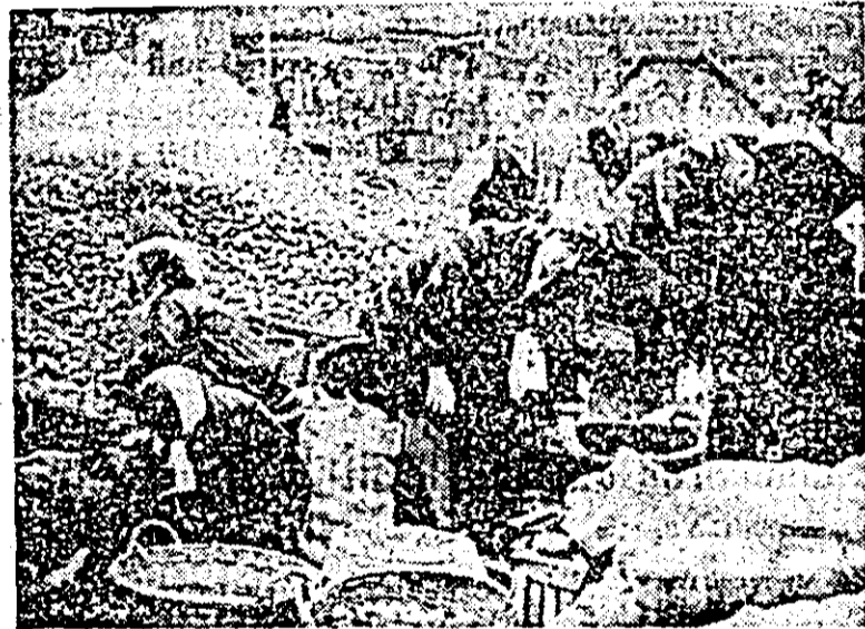
În depozitul C.L.F. din cartierul Subcetate se lucrează de zor la însilozatul cartofilor.