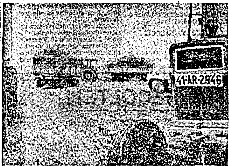
La I.A.S. Fintinele, remorcile se umplu una după alta cu nutreț local, care este dus de îndată la locul de însilozare.