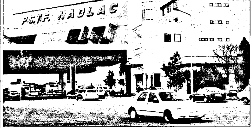
Vama Nădlac - o altă imagine.

Ministerului Finanțelor, privind lucrările de investiție, a blocat situația de lucrări. S-a constatat atunci că nu au fost respectate, de către constructori, termenii de finalizare a lucrărilor nici la Vama Nădlac, nici la Vama Vârșand. S-a hotărât atunci să nu se mai plătească lucrările deja efectuate până nu se iau penalitățile de întârziere.