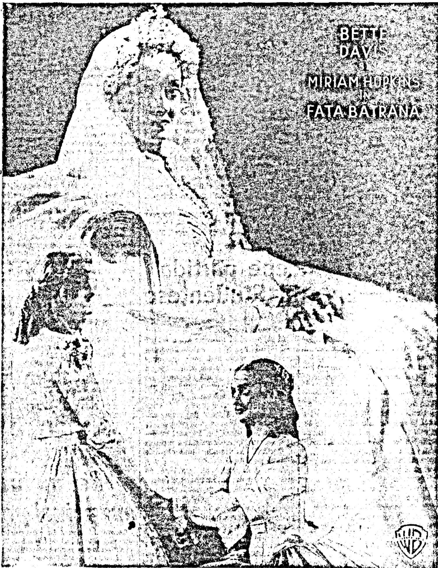
BETTE DAVIS și MIRIAM HOPKINS în FATA BĂTRÂNĂ