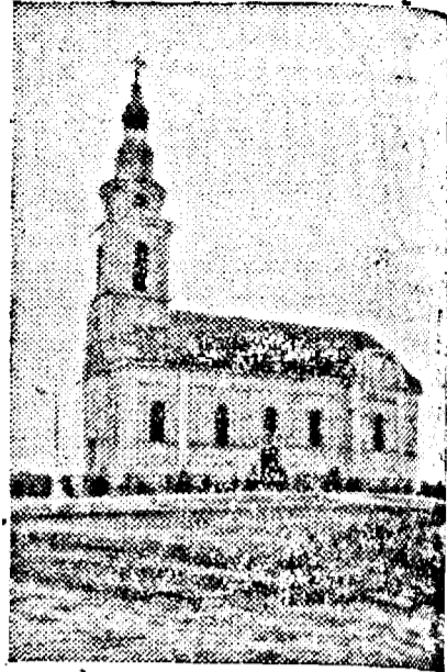
Biserica română ortodoxă din Gad

În anul 1924, românii ortodoksi din comuna Gad n'aveau biserică și nici preot. Trebuințele lor religioase erau satisfăcute de preotul sârb. Cercetau biserică sârbă, tot așa școala sârbească.