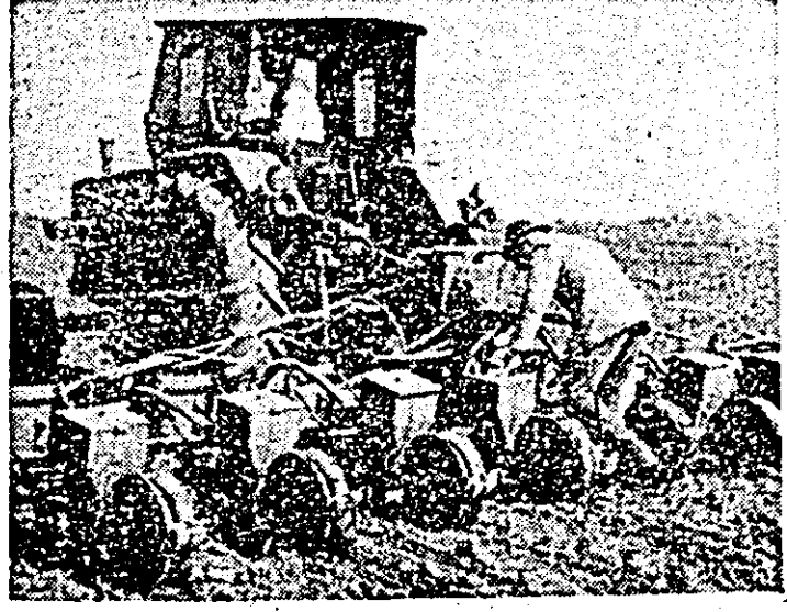
În aceste zile, pe ogoarele consiliului agroindustrial Pecica, se acționează, cu toate forțele, pentru încheierea însămînțării porumbului.

Membrii cenaclului literar „Amfiteatru” — la Arad ● Manifestări pionierești consacrate aniversării creării partidului ● O familie de dascăli ● Informații pentru toți ● Sport ● Vast și mobilizator program de acțiune