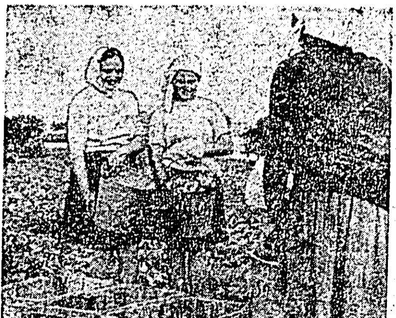
Recoltatul legumelor la I.A.S. Ulvlaiș.