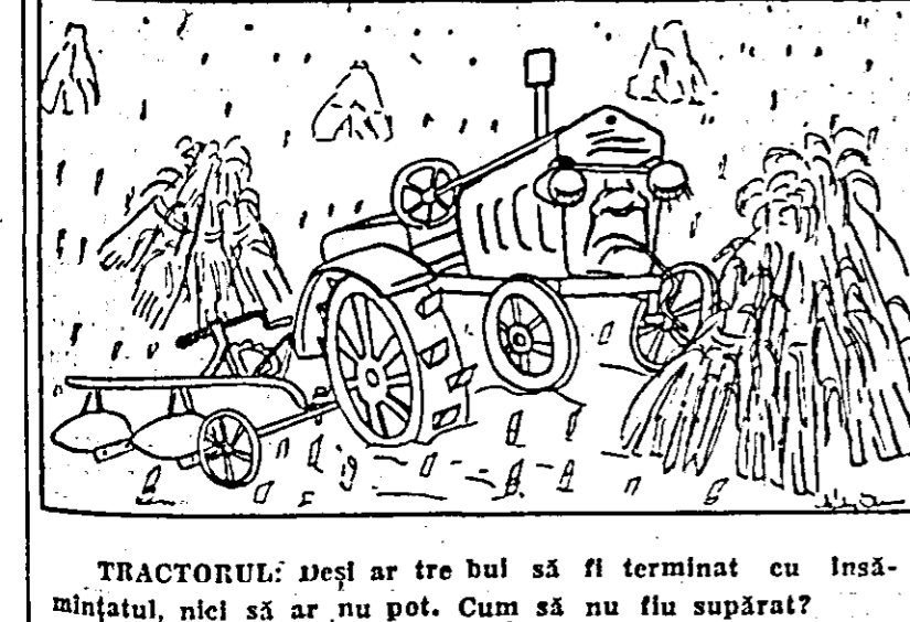
TRACTORUL: Deși ar tre bui să fi terminat cu însă-mînțatul, nici să ar nu pot. Cum să nu flu supărat?

Unele gospodării agricole colective ca cele din Mîndruloș Sîria și altele au rămas în urmă cu semănatul grîului pe ntru că nici pînă acum n-au terminat recoltatul porumbului și deci n-au eliberat terenul pentru a se putea face arături.