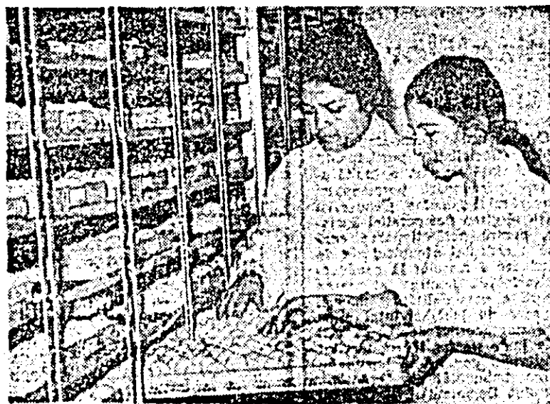
Aspect de muncă de la ferma nr. 13 a I.A.S. „Avicola”, specializată în incubarea ouălor. Aici se scot lunar peste 800.000 pui.