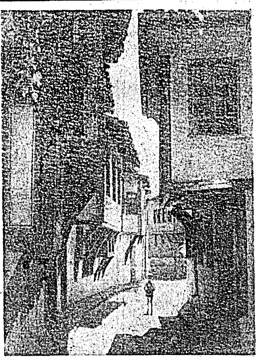
R. P. BULGARIA. În unele orașe din R.P.B. se remarcă străzi și clădiri adevărate opere arhitectonice care au rezistat timpului, ilustrând stilul arhitectural băștinăș de un real farmec. În fotografie: Stradă într-un vechi cartier al orașului Plovdiv.

Emirul Abdel Aziz, ministrul saudit al apărării, s-a însoțit vineri la Djeddah, în urma unei vizite de șapte zile pe care a efectuat-o la Cairo, la invitația omologului său egiptean, Mohamed Sadek, relatează agenția Franco Presse.