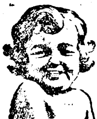
OLYAN GYÖNGÉDEN FELFRISÍT, EZ EGY OLYAN TISZTA ÉS FINOM SZAPPAN, HOGY AZ ANYAK TELJES BIZALOMMAL HASZNÁLJÁK GYERMEKEIK RÉSZÉRE. Illata lágy és kellemes. . .

A bucuresti-i sziguranca egész napon keresztül folytatta az ügyben a nyomozást és ennek során még azt is sikerült megállapítania, hogy a hat tagú társaság a fentiekben kívül vasuti bérletjegyeket, továbbá 50 százalékos kedvezményű jegyeket is hamisított. A sziguranca detektívjei egyébként ma házkutatást tartottak az összes őrizetben lévő gyanúsítottaknál és ennek során többszáz félfára vasuti igazolványt találtak, amelyeket lefoglaltak és azonnal a sziguranca alá szállították. A hamisító társaság egy joghallgatóból, egy tanítóból és négy köztisztviselőből áll. A hamisítottok tisztelemek teljes tisztázása végett egész éjszakán keresztül folyik a vizsgálat és az ügy egy-két napon belül már valószínűleg tisztázva is lesz.