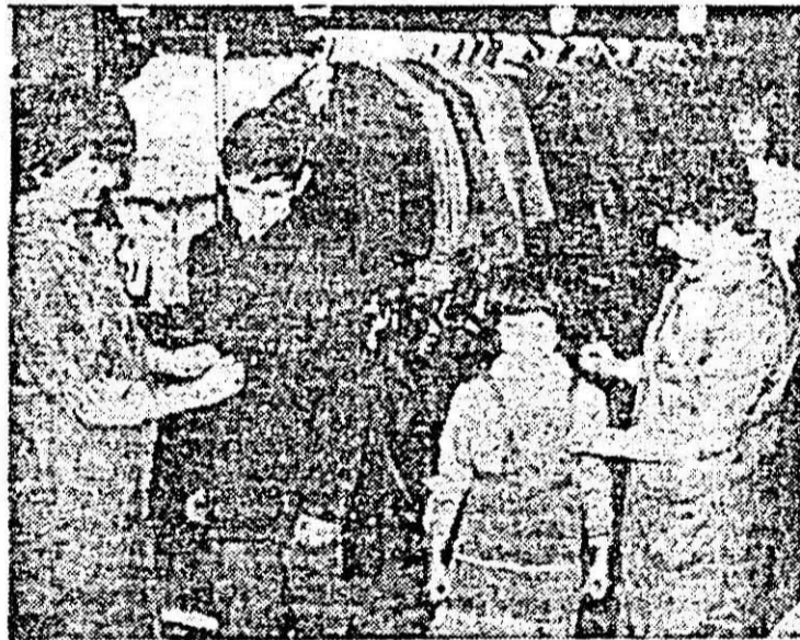
În strictă actualitate, uniformele școlare. Aspect din raionul de specialitate al magazinului universal „Zirldava”.