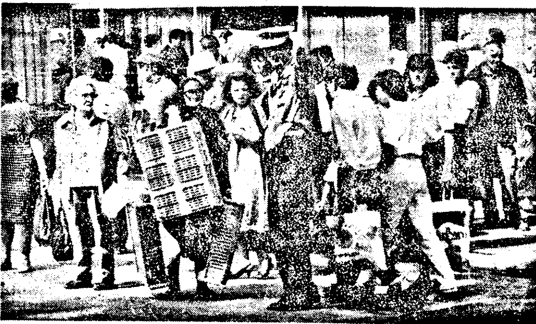
— Unde-i, măică, economia de piață? — Drept înainte.

ANUL IV | Nr. 652 | Sîmbătă 20 VI — Duminică 21 VI '92 | 8 pag. — 10 lei