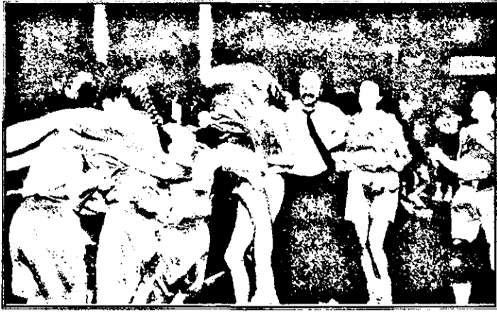
Bucurie mare după victoria echipei României din finalul meciului de baschetballiste poloneze.