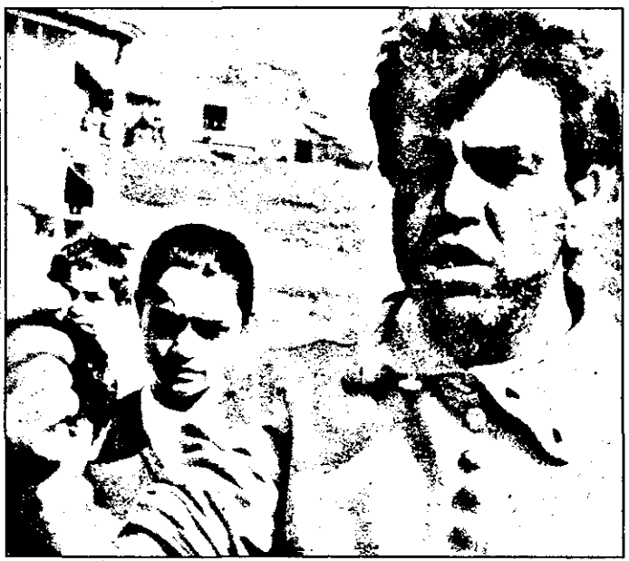
„Dacă nu ni se dă pământ, noi, romii din Sântana mergem și la Consiliul Europei”