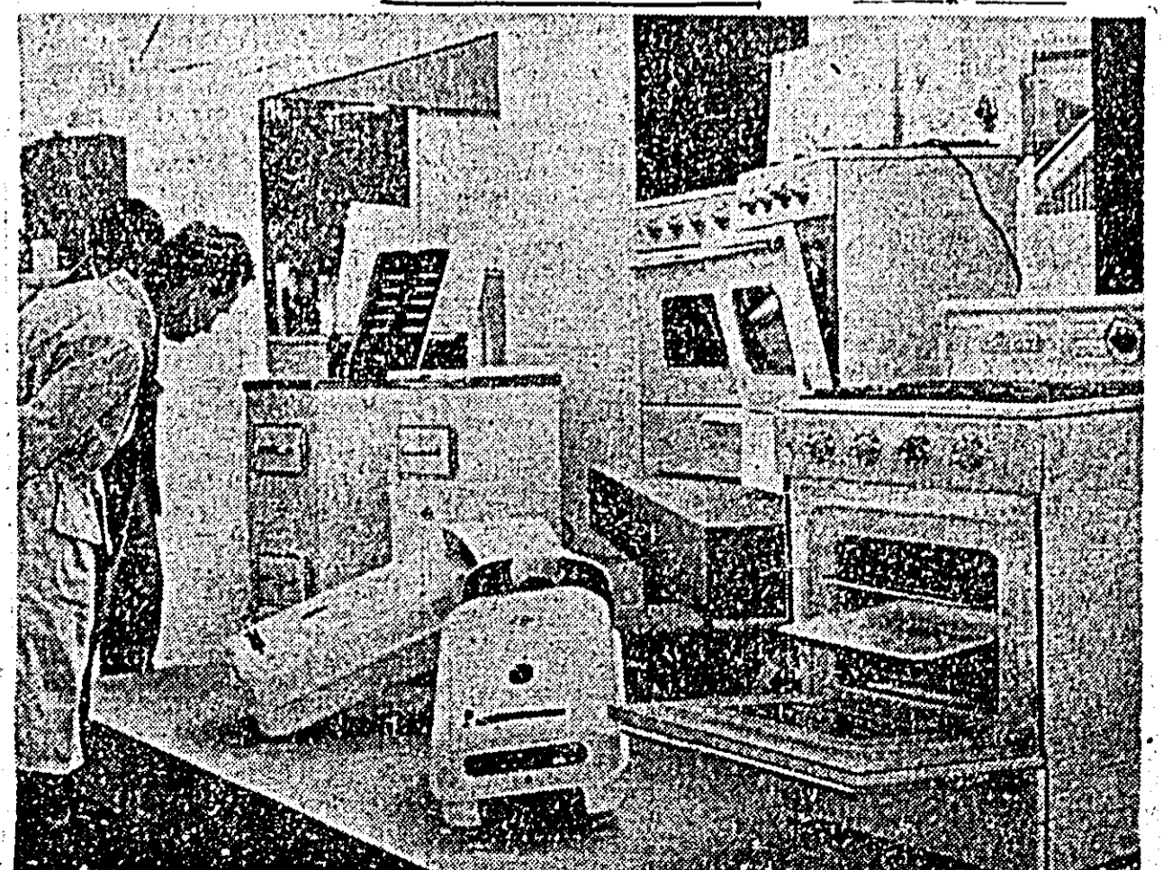
Tractorul nostru prezintă un aspect de cel de-al IV-lea Pavilion de mostre deschis recent în Capitală.

În baza sarcinilor de plan ale gospodăriei, în această toamnă s-au însămînțat toate culturile prevăzute ca lucrarea pe 32 hectare, culturi pentru masă verde pe 140 ha și 250 ha de orz.