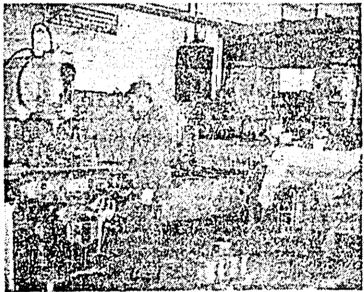
Aspect de muncă în sculăria întreprinderii de vagoane Arad.