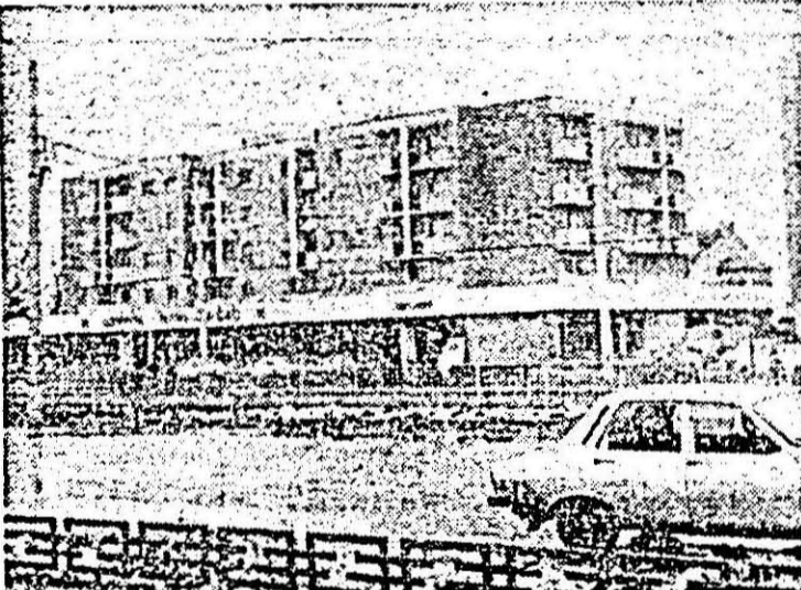
Vedere din Arad, Plașa UTA.