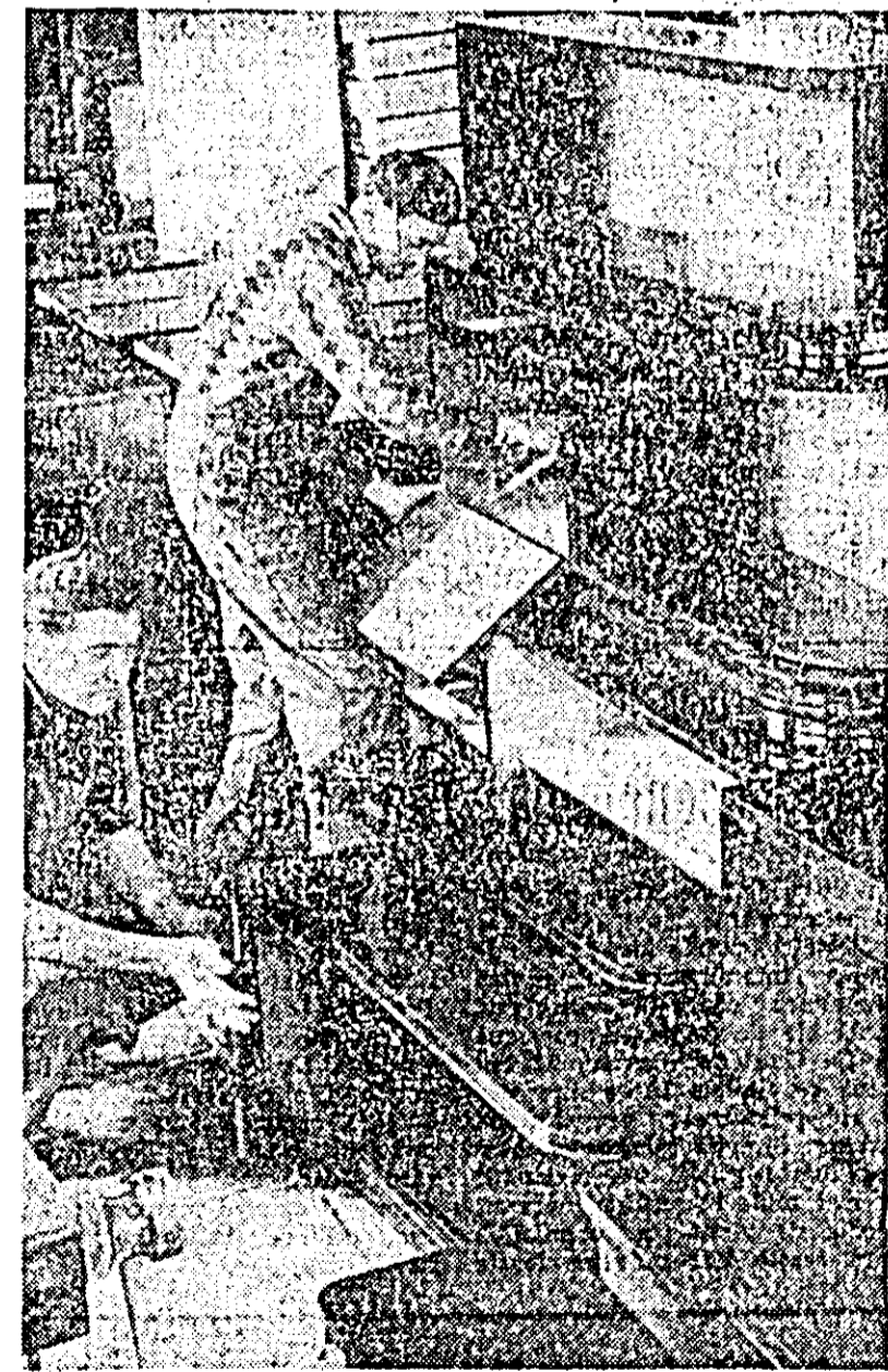
În secția mobilă lustruită a întreprinderii regionale „Progresul” se lucrează la montarea unei noi camere combinate tip T.V.

Mal mulți participanți la discuții au sesizat că nici orarul magazinelor de desfacere a mobilei nu este bun. Propunînd ca el să fie în așa fel întocmit încît mobilă să se poată ridica din depozit ziua nu seara, cînd în majoritatea cazurilor lucrătorii din depozit, fiind grăbiți, îi lipsesc pe cumpărător de posibilitatea de a controla riguros ce cumpără. Apoi, manipularea mobilei neatenț nu se face cu atenție, lucru ce duce la degradarea ei.