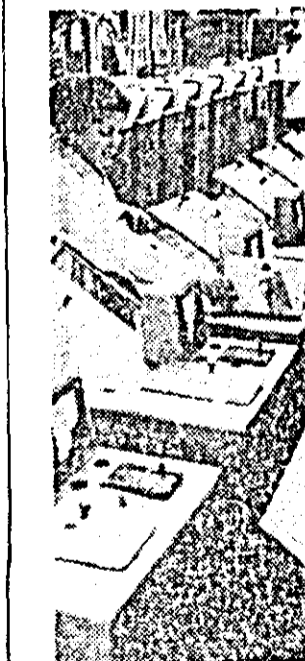
Uzina „Mosröntgen” din Covpa produce între altele și fier pentru încercarea materialelor de izolație de înalt voltaj. Această aparatură este montată în Clisfu. Sectrul de instalare a instalațiilor.

■ CARACAS. Zece bombe au explodat pe diferite străzi ale capitalei Venezuelei, Caracas, împărștîind manifestații care denunță amestecul guvernului în asasinarea lui Alberto Lovera, unul din conducătorii Partidului Comunist din această țară. Lovera, după cum se știe, a fost găsit torturat pînă la moarte, în luna octombrie anul trecut în orașul Falcon. Manifestele împărștiate duminică pe străzile Caracasului anunță opinia publică din Venezuela că asasinarea lui Alberto Lovera este o acțiune a poliției venezueliene.