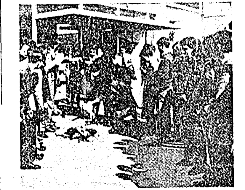
După o „adunare liberă” de sprijinire a colegilor din Barcelona, studenții Universității din Madrid ar zărele ostile acțiunilor lor revendicative.

ATENA 22. — Correspondentul Agerpres, C. Alexandroaie, transmite: Într-o grotă a muntelui Pelion din Grecia au fost descoperite opere de artă datînd din perioada paleolitică, adică de acum 15-20.000 de ani î.e.n. Este vorba de plăci din piatră pe care sînt gravate figuri de oameni și animale, opere apreciate a fi cele mai vechi din Grecia. Grota în care s-au găsit aceste plăci din piatră se află la o altitudine de 500 m de suprafața mării. Pe muntele Pelion au fost găsite și explorate, pînă în prezent, 24 de grotte. La poalele muntelui, într-o grotă din vecinătatea lacului Karla, au fost descoperite picturi murale colorate despre a căror origine încă nu se poate spune nimic. Din cercetările savanților greci și străini făcute în Tesalia reiese că această regiune a început să fie populată în perioada omului de Neanderthal, și aproape acum 35.000 de ani și-a făcut apariția în Grecia homo sapiens.