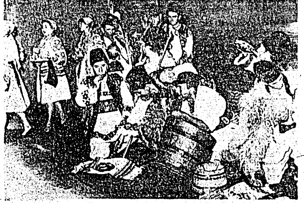
Ansamblul folcloric din Rușii Munți — județul Mureș — interpretînd „Măsura oilor”, obicei al locului.