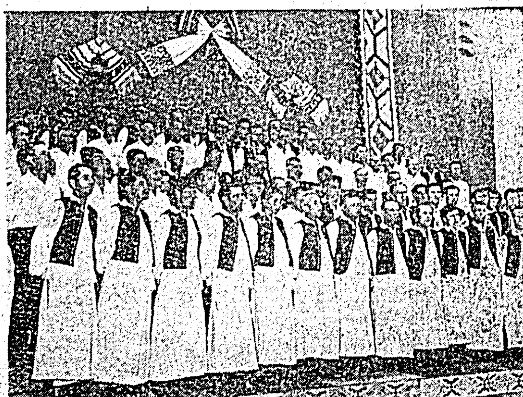
Corurile băbătești reunite din Almaș și Șiria, care au reprezentat Județul Arad la acest festival.