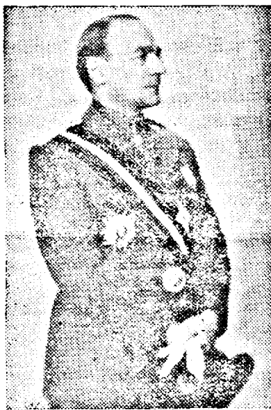
D. ARMAND CĂLINESCU Vicepreședintele Consiliului de Miniștri

Se împlinește astăzi un an, de când Majestatea Voastră, aici în Sala Tronului, înconjurat de Curte