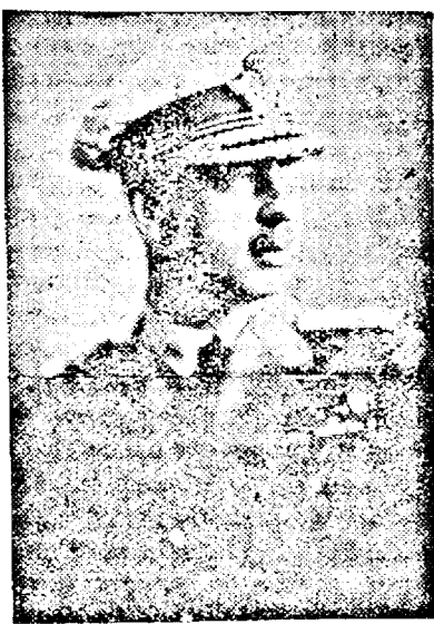
Majestatea Sa Regele Carol al II-lea

Cu o nespusă mulțumire am putut constata că însuflețirea care a zguduit Poporul Meu cu prilejul plebiscitului