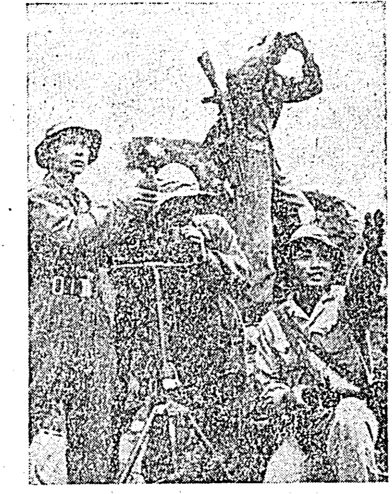
Obiectivele și bazele americane aflate în imediata apropiere de marile centre urbane sau în interiorul lor sînt frecvent atacate de tirul mortierelor forțelor patriotice. IN FOTOGRAFIE: patrioți sud-vietnamezi reglind tirul de mortiere în apropiere de Hue.

saigonezi au fost uciși. Tot în apropierea Saigonului, o unitate de cavalerie americană a căzut într-o ambuscadă organizată de patrioți.