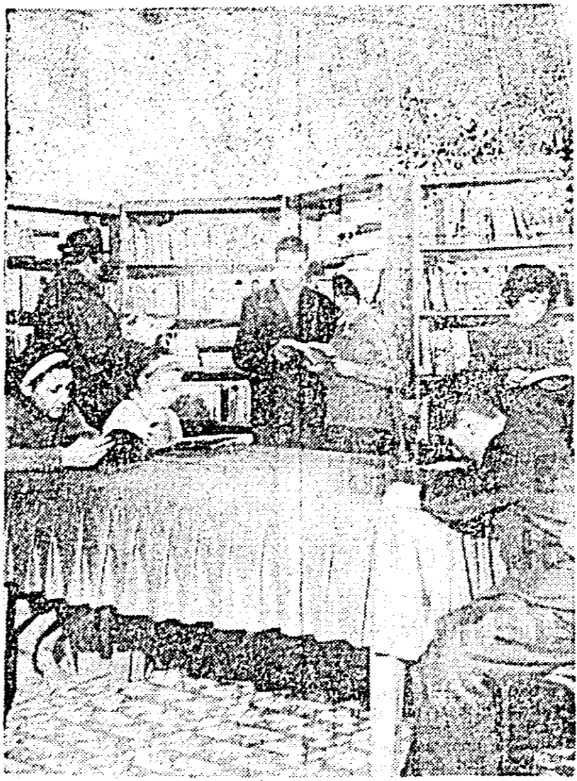
Biblioteca Elena Șilea din comuna Păuliș își sprijină permanent numeroși cititori pe care i-a atras la bibliotecă. Iată îndrumind lectura cititorilor din ei.

Avem convingerea că în comuna Gurba activitatea cultural-artistice, bogată în tradiții, va cunoaște o continuă sporire, în cîștindu-se în continuare printr factorii de bază ce alcătuiesc viața spirituală a satului. Condițiile existente — materiale și umane — contopite cu pricepera, destoinicia și hotărîrea cetățenilor comunei, a intelectualilor ei, constituie o chezie a acestor vitoare și continue îmbunătățiri.