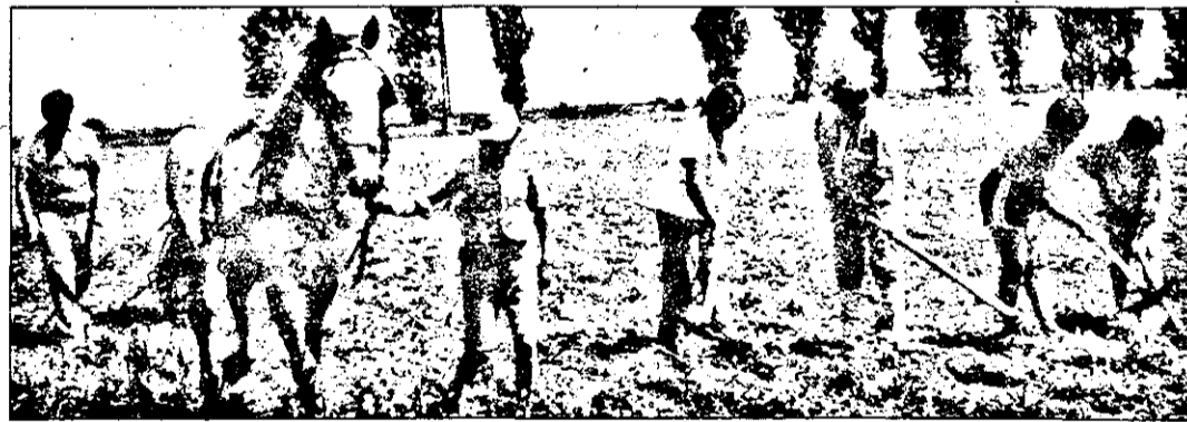
Unii cu sapa, alții... cu calul. Evident, la prășitul porumbului.

Intre atâtea și atâtea lucruri de care se plâng producătorii agricoli este și acela că nici până la această dată nu se cunoaște prețul la care va fi achiziționat de către stat grâul din recolta acestui an. Și totuși, pentru că vremea scerșului se apropie se pare că Ministerul Agriculturii s-a hotărât: pentru a stimula producătorii agricoli interni și a descuraja importul se intenționează majorarea actualului preț de achiziție (140 lei kilogramul) la 250 lei kilogramul. Noul preț preconizat are în vedere prețurile la grâu pe piața mondială, care sunt cuprinse în general între 200 - 350 lei kilogramul. În cazul în care guvernul va aproba achiziționarea grâului cu 250 lei kilogramul, se pare că acest preț se va dovedi suficient de stimulant pentru ca țărani să nu mai stocheze recolta iar fondul de consum să poată fi asigurat integral din producția internă. Socotind cheltuielile făcute la hectar de 350 - 400.000 lei și o producție medie de 3500 - 4000 kilograme, noul preț de achiziție la grâu ar aduce țărănilor un profit de cca 400 - 500.000 lei la hectar. Ceea ce nu e nici foarte mult, având în vedere prețurile actuale, dar nici puțin.