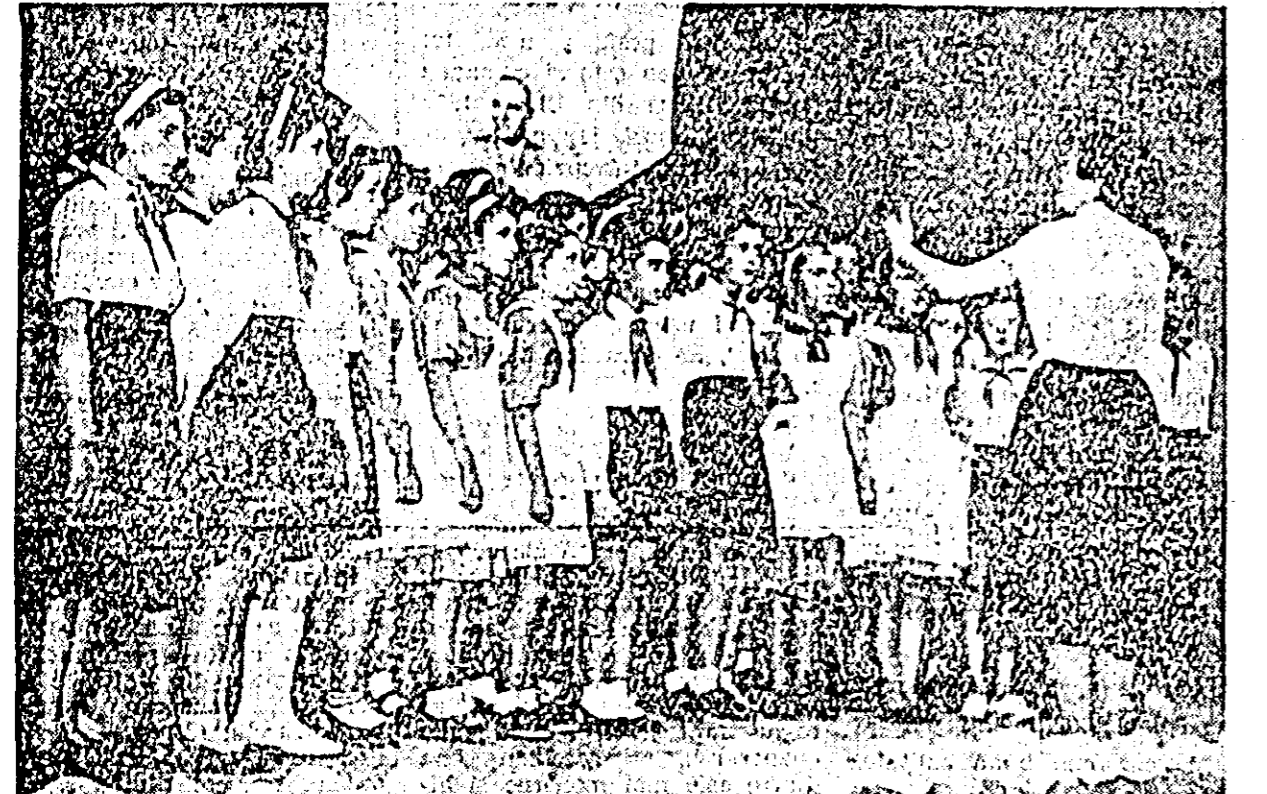
Recent, în cartierul Grădiște s-a terminat lucrările de reamenajare a cîminului cultural. Inaugurarea acestui cîmin a avut loc zilele trecute cu un spectacol cultural-artistice prezentat în cinstea celui de-al III-lea Congres al P.M.R. Deși nouă, această instituție culturală a început să desfășoare o bogată activitate artistică și culturală de masă în scopul ridicării nivelului cultural al locuitorilor din cartierul Grădiște. În acest scop au luat ființă formații de cor, dansuri populare, balet; s-au deschis diferite oceruri artistice. ÎN CLISEU: aspect de la serbarea de inaugurare al cîminului cultural din Grădiște.