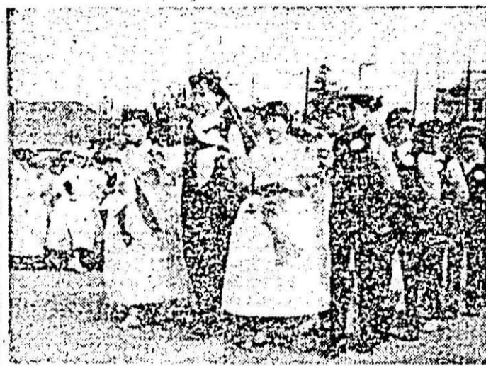
Aspect de la parada costumelor populare.